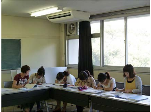
일본어로 제출서류 작성