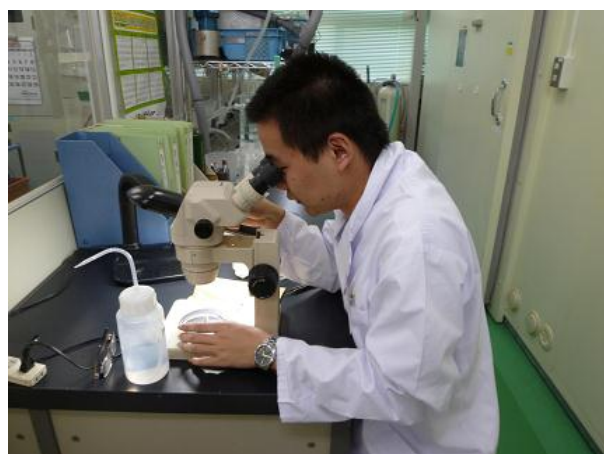
毒性試験・指標生物の異常確認