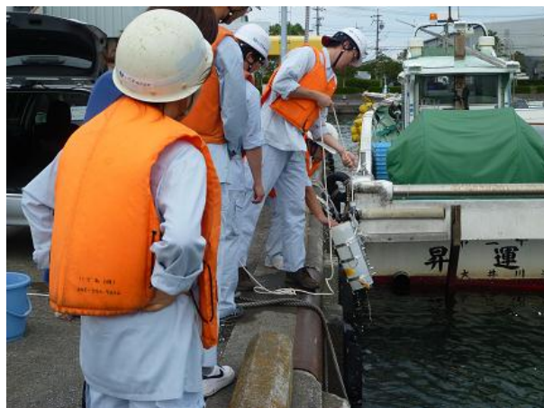
生物分野・指標生物サンプリング